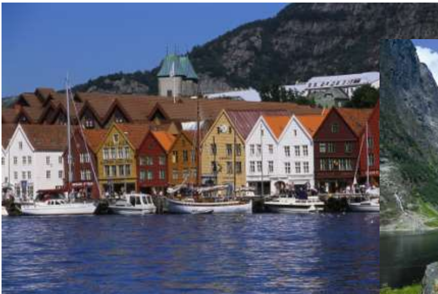
ハンザ同盟の歴史を残すベルゲンの美しい町並み