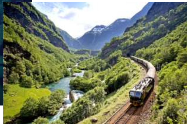
ノルウェーを代表する“フロム山岳鉄道”