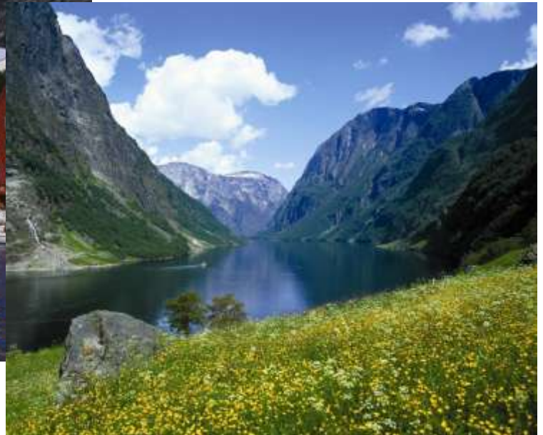
世界遺産ネーロイフィヨルド