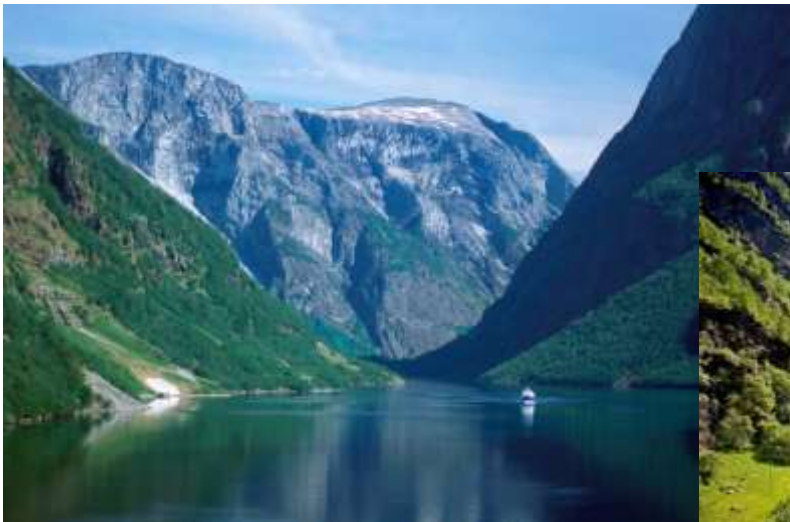
世界最大級のソグネフィヨルドのクルーズ