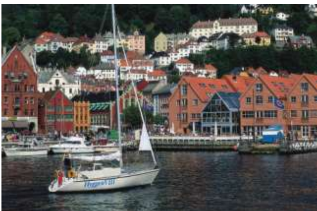
ベルゲンの美しい町並み

【通貨】 通貨単位はノルウェー・クローネ(Krone)、補助単位にオーレ (Ore)があり、1kr=100 Ore 紙幣：50kr、100kr、200kr、500kr、1000kr、硬貨：50 Ore、1kr、5kr、10kr、20kr ※ノルウェー・クローネ=約15円（2012年1月現在）