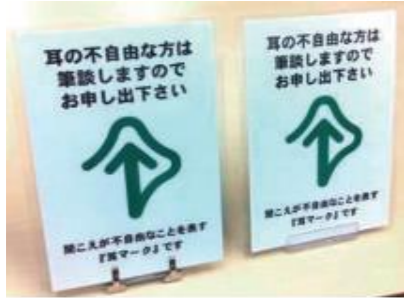
ステンレス(左) プラスチック(右)