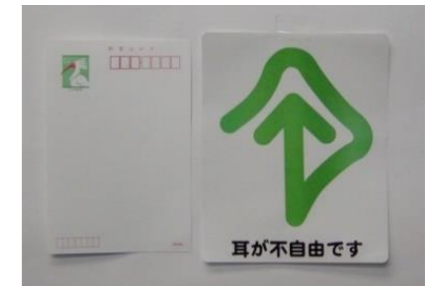
※車用は内側から貼るタイプです