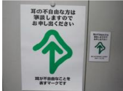
左 ポスター(A3) 右 表示板用カード