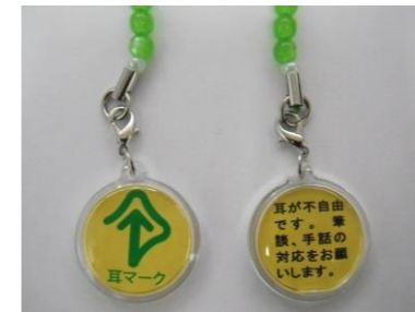
左 表面 右 裏面