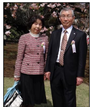
安部総理招待 新宿御苑にて

※ミニ散策 定員 40 名（別途 300 円） 浜っ子ガイドによる 港町横浜の歴史ロマンに巡り会う旅