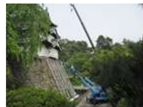
「弘前城」石垣大工事