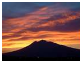
ゆうやけの「岩木山」